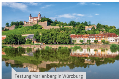
Festung Marienberg in Würzburg