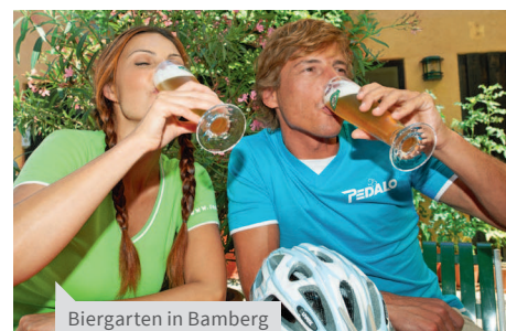
Biergarten in Bamberg