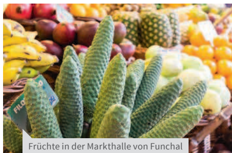
Früchte in der Markthalle von Funchal