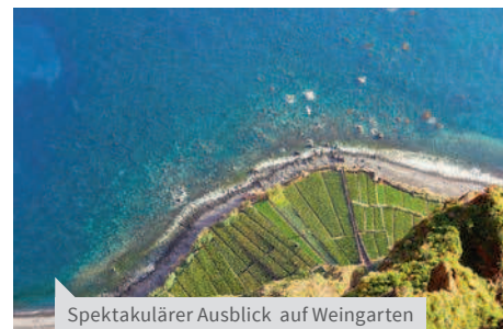
Spektakulärer Ausblick auf Weingarten